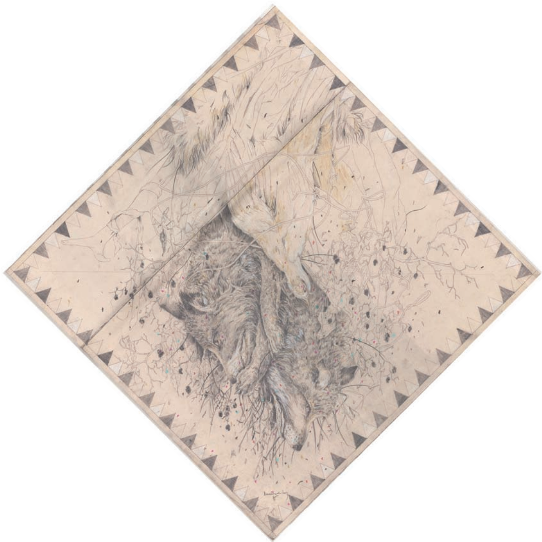
„o.T.“ (2015) · 90,0 x 90,0 cm · Bleistift, Farbstift, Pastell