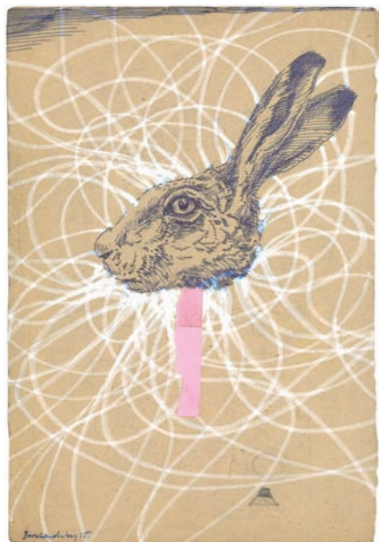
oben links: „o.T.“ (2015) · 31,5 x 27,0 cm · Bleistift, Pastell, Collage oben rechts: „o.T.“ (2013) · 30,5 x 23,5 cm · Bleistift, Collage unten links: „o.T.“ (2015) · 33,0 x 27,0 cm · Bleistift, Aquarell, Collage unten rechts: „o.T.“ (2015) · 31,0 x 21,0 cm · Tinte, Acryl, Collage