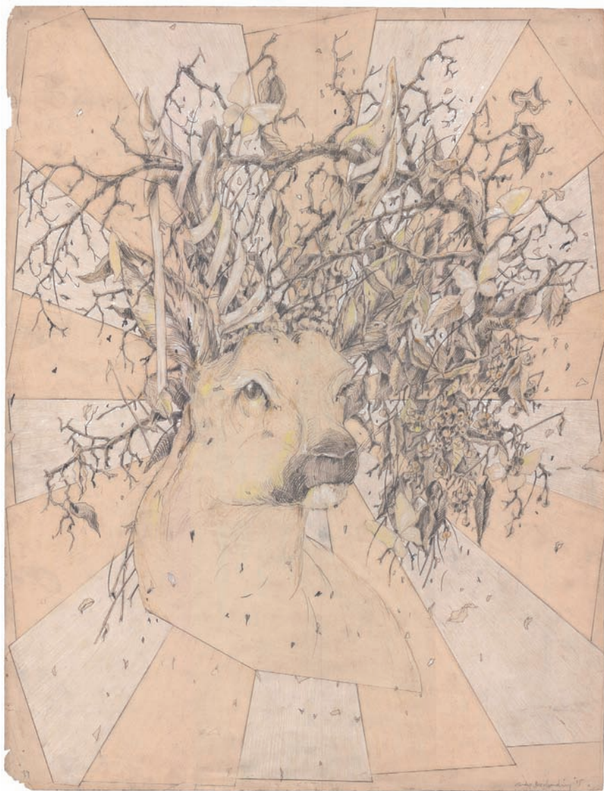
„o.T.“ (2015) · 66,0 x 50,0 cm · Bleistift, Farbstift, Pastell