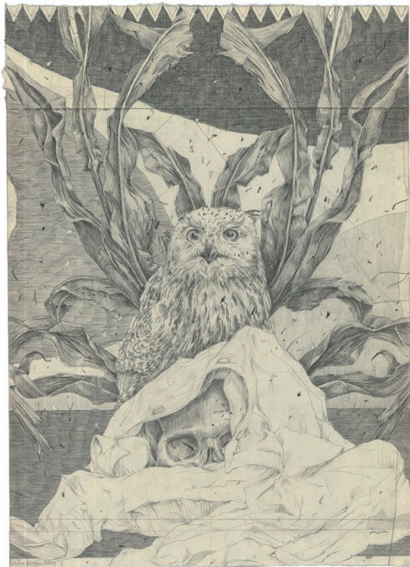
„o.T“ (2013) · 64,0 x 45,0 cm · Bleistift