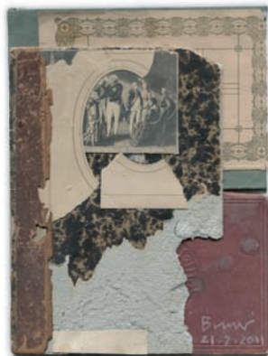
„Ohne Titel“, Collage, 17,0 x 22,5 cm, 2011