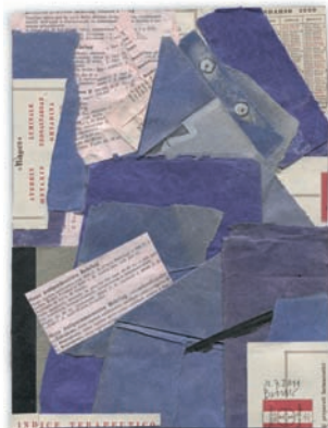
„Ohne Titel“, Collage, 17,0 x 23,0 cm, 2011

Weitere Collagen und Aquarelle von Jörg D. Breuer unter: www.cca-gallery.net | www.joerg-breuer.de sowie nach Absprache in unseren Ausstellungsräumen CCA&A GALLERY | Obere Lindenstraße 8 | 21521 Wohltorf