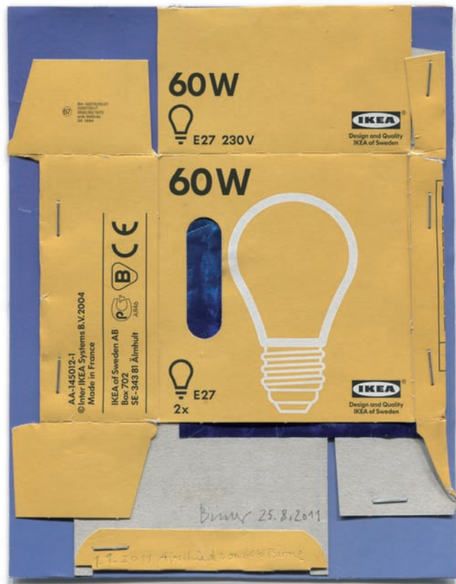
„Abschied von 60 W Birne“, Collage, 15,0 x 20,0 cm, 2011