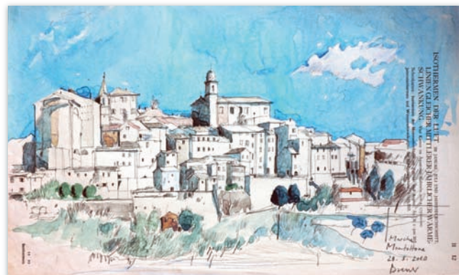
„Marche Montottone“, Aquarell, 42,5 x 27,5 cm, 2010